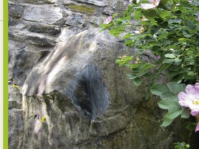
Berührstein beim Rathaus