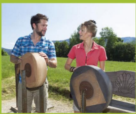
Klangweg „Dem Hören ein Weg“