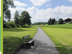
Radweg unterhalb Naturbad