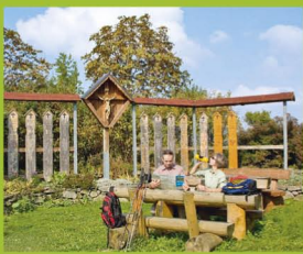
Jakobsweg bei Brünst