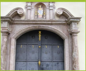
Wallfahrtskirche Märia Geburt