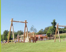
Spielplatz beim Naturbad