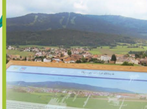
Aussicht vom Füller