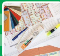
INNENAUSBAU · ESTRICH · ISOLIERUNG