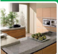
KÜCHEN UND ELEKTROGERÄTE