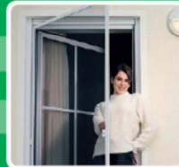
ROLLLÄDEN · ZUBEHÖR · INSEKTENSCHUTZ