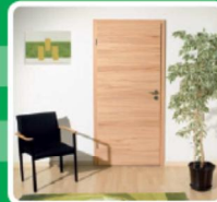
INNENTÜREN · OBJEKTTÜREN