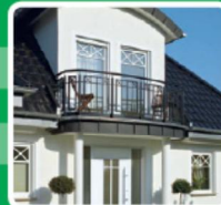
BALKONE · TERRASSEN