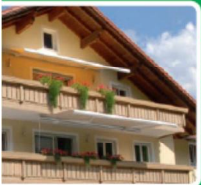
SONNENSCHUTZ · MARKISEN · JALOUSIEN