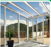
WINTERGÄRTEN · ÜBERDACHUNGEN