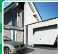
GARAGENTORE UND ANTRIEBE