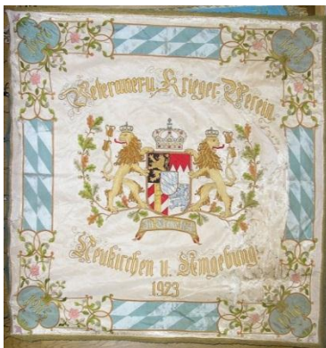
Fahne von 1923, geweiht 1924