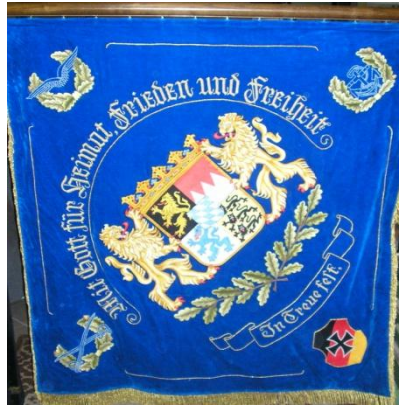
Neue Fahne von 1989