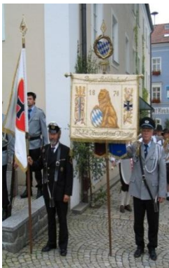
Neue Standarte des VdRBw mit der BSB-Kreisstandarte