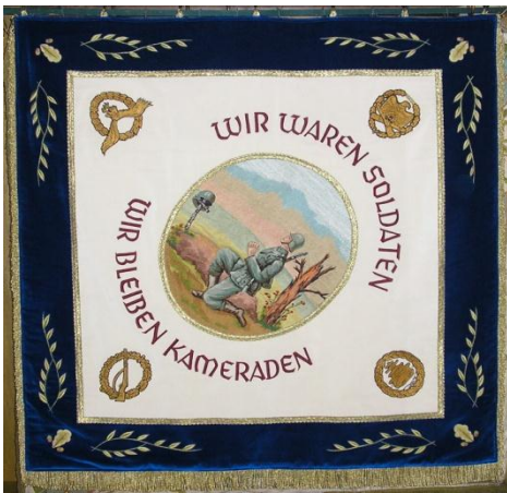
Renovierte Fahne von 1964