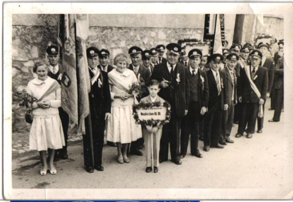
Der Kriegerverein beim Fest in Lam 1961