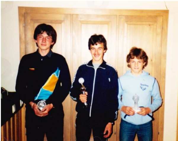
Jugenderöffnungsschießen im Schützenheim beim Gasthaus Schamberger